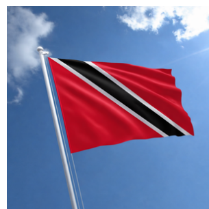
Trinidad y Tobago