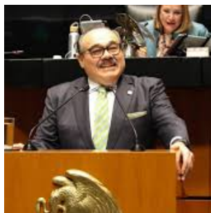
Jorge Carlos Ramírez Marín