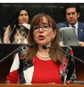
Yeidckol Polevnsky Gurwitz