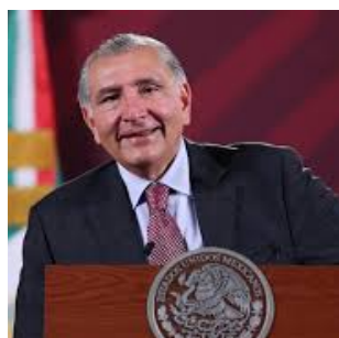
Adán Augusto López Hernández