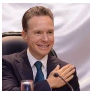
Manuel Velasco Coello