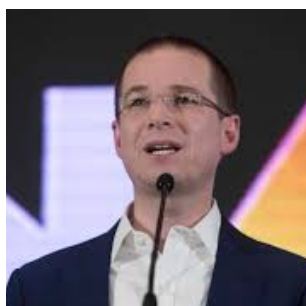
Ricardo Anaya Cortés